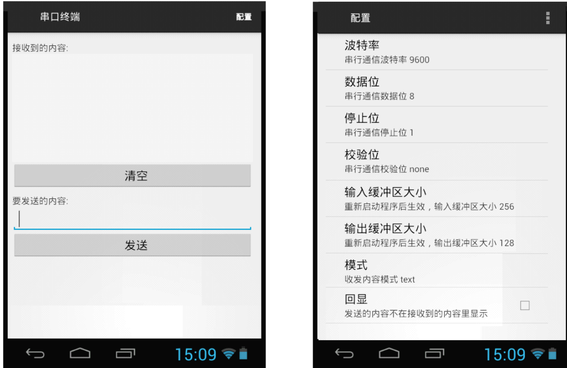
“串口终端.APK” 的通信界面和设置界面。

注意 USB232AG 的通信软件协议是 Serial Port（USB 设备模式）。而 USB232ET 的软件协议是 TCP/IP 的 Socket（USB-OTG 模式），软件编程不一样。